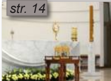
Rozhlasová púť do Krakova