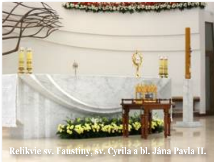
Relikvie sv. Faustíny, sv. Cyrila a bl. Jána Pavla II.