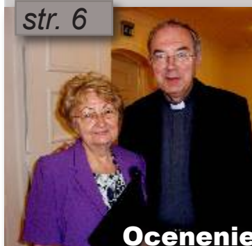
Ocenenie Dar roka 2010