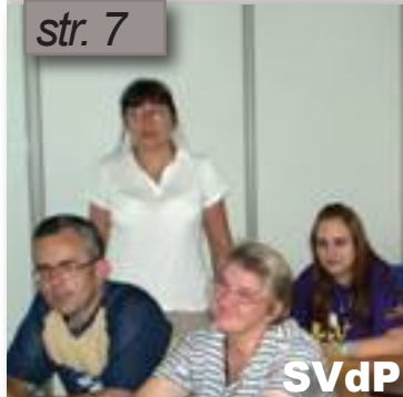
SVdP na festivale Lumen